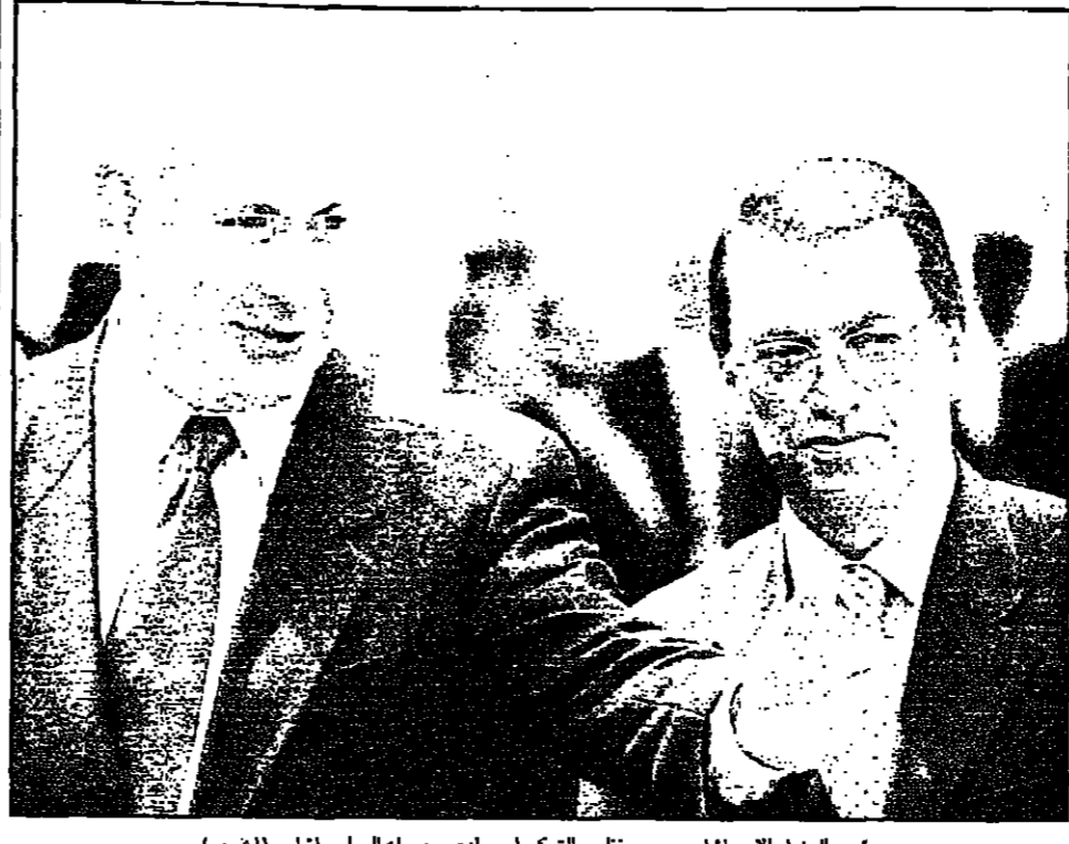
رئيس الوزراء الاسرائيلي يرحب بظهور التركي امس لدى وصوله الى اسرائيل

القديس - ا ف ب - رويترز: وصل رئيس الوزراء الاسرائيلي سمور صيدو صباحاً الى عمان لاجتماع مع ولي عهد الاردن الحسين بن طلال. وقد استقبله في المطار وزير الخارجية الاسرائيلي شيمون بيريز. وصرح صيدو لوسائل الاعلام ان العلاقات الاردنية الاسرائيلية جيدة، وانه يثق في قدرة الاردن على حل النزاعات بالطرق السلمية. كما اشار الى ان الاردن يحرص على عدم الانحياز في النزاعات الدولية، وان العلاقات الاردنية الاسرائيلية ستستمر على ما هي عليه.